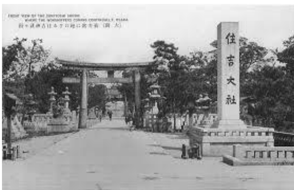
Το μέρος όπου ο Κένβα διοργάνωσε πρώτη επίδειξη του Καράτε στο Χόνσου (κύρια νησιά της Ιαπωνίας)

Το 1945, μετά το τέλος του πολέμου, οι πολεμικές τέχνες απαγορεύτηκαν