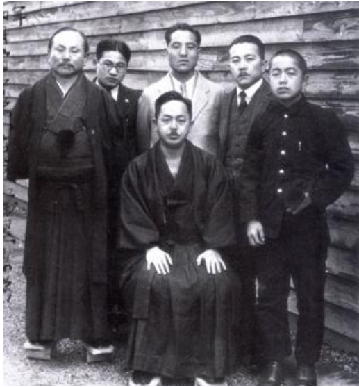
Δεξιά ο Κένει Μαμπούνι, αριστερά ο Γκίτσιν Φουνακόσι

από την Αμερικάνικη στρατιωτική διοίκηση. Ευτυχώς το Καράτε ήταν η μοναδική πολεμική τέχνη που επιτρεπόταν ακόμα και σε τέτοια περίοδο.