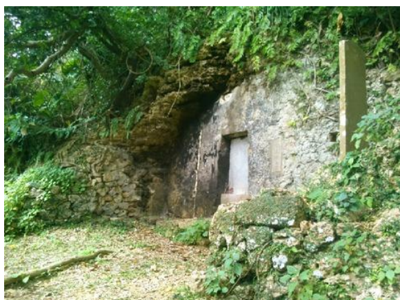
Ο τάφος του Κένγκιου Οσίρο. Δέχεται ακόμα σήμερα αρκετούς επισκέπτες.

Επειδή ο Κένβα ήταν αδύναμο παιδί, οι γονείς του έλεγαν συχνά την ιστορία του Κένγκιου Οσίρο για να τον ενθαρρύνουν, ώστε του γεννήθηκε ένα κίνητρο για να δυναμώσει την φυσική του κατάσταση. «Επειδή ήμουν αδύναμο παιδί, πρόσεχα πολύ την υγεία μου. Πριν ξεκινήσει το καράτε, άρχισα να κάνω κάποιες ασκήσεις», αναφέρει ο Κένβα Μαμπούνι.