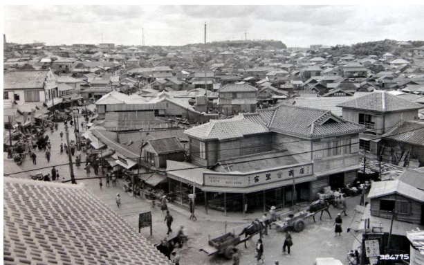
Η πόλη Σούρι, στο τέλος του 19ου αιώνα

«Κάθε μέρα ξυπνούσα στις 5 το πρωί, δούλευα Κάτα, Μακιβάρα και άλλες ασκήσεις για δύο ώρες πριν πάω στο γυμνάσιο. Μετά το σχολείο έκανα σκληρή προπόνηση με δάσκαλό μου. Μόλις νύχτωνε, γύριζα στο σπίτι, διάβαζα για μιάμιση ώρα και μετά γύρω στις δέκα μέχρι μία το βράδυ έκανα προπόνηση καράτε. Για 6 χρόνια κάθε μέρα έκανα προπόνηση, ακόμα και ο τυφώνας δεν μπορούσε να με σταματήσει.»