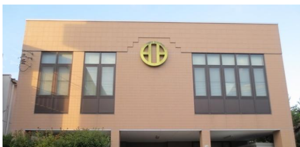
Το Αρχηγείο της W.S.K.F.