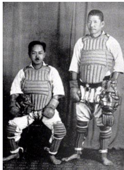
Δοκίμασε αγώνα κούμπτε με τα προστατευτικά

Το 1997 εγκαινιάστηκε Χόνμπου Ντότζο (κεντρική σχολή) στην πόλη Ασάκα, όπου στεγάζεται και το κεντρικό γραφείο του αρχηγείου.